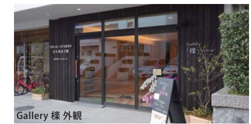
Gallery 様 外観

ングをご利用下さい。トイレ・手洗・キッズコーナーもあり、椅子は10脚をご用意しております。その他詳細は、エヌテックまでお申し付け下さい。