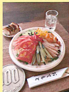
7月製作品 「冷やし中華と焼き餃子」