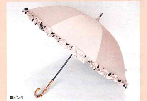
↓「サンバリア 100」ネットショップ http://uv100.jp

特長です。99%(1級遮光)とどう違うの?についてはHPをご覧くださいとして、愛用者によると肌への影響だけでなく、体感温度も大きく違うそうです。ちょっといいお値段ではありますが、今年はこの日傘を入手して真夏を乗り切りたいと思います! 注意:夏の前に売り切れる可能性あり、だそうです。 ミドルサイズで、12,600円(税込)〜 サイズ・模様共に選べます。