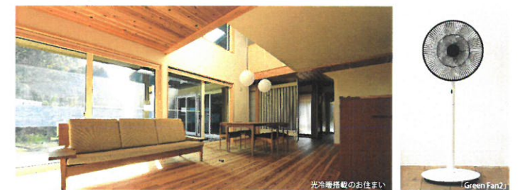
光冷暖機のお住まい Green Fan2

その場で実際感じてみることでしか、「体感」出来ない音と匂い。好ましい音のあり方や許容範囲は人によって違いますので、是非足を運んでリアルに感じてみてくださいね。