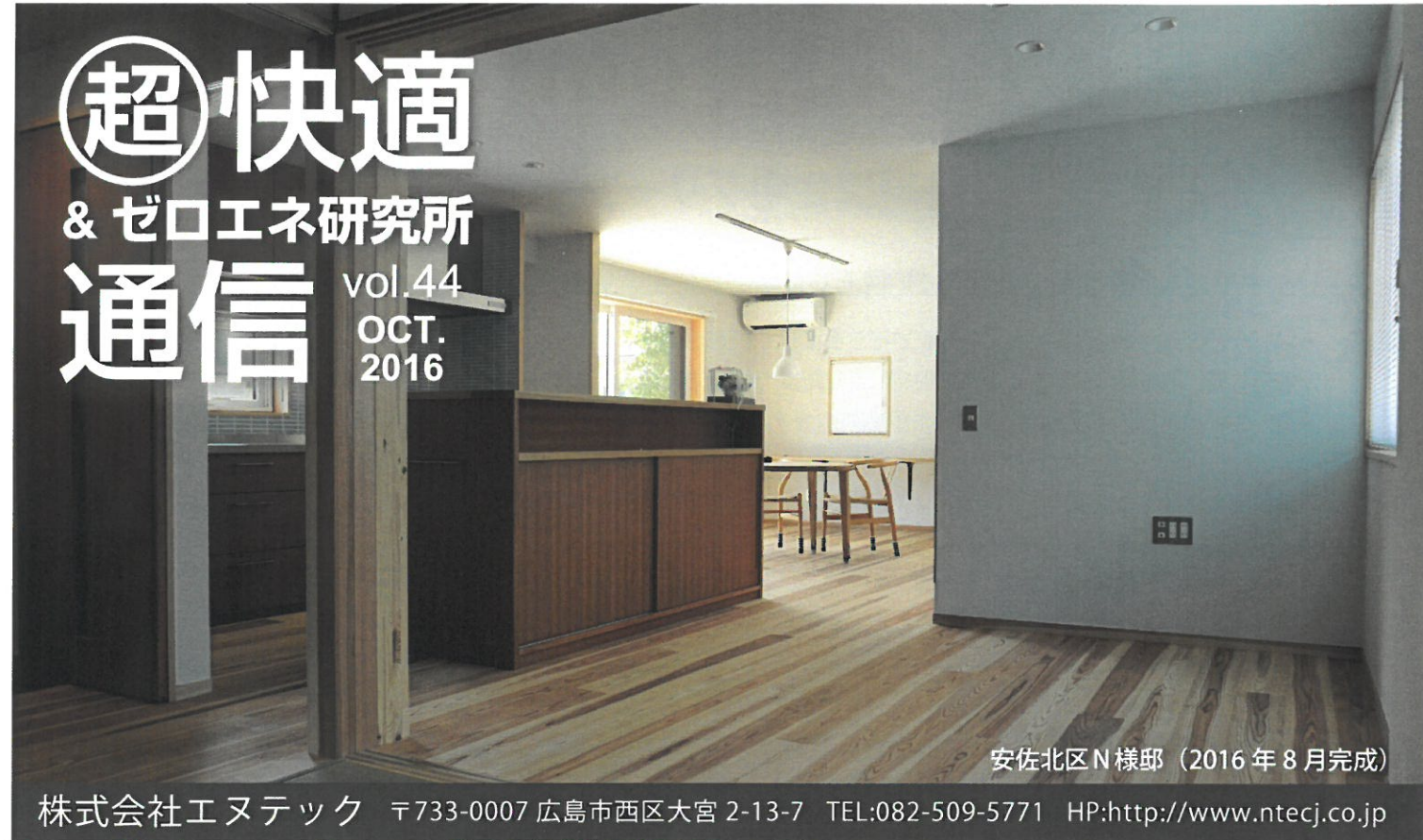
安佐北区N様邸（2016年8月完成）

株式会社エヌテック 〒733-0007 広島市西区大宮 2-13-7 TEL:082-509-5771 HP: http://www.ntecj.co.jp