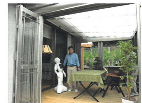
ガーデンルーム完成時にペッパーさんと記念写真。

健康にはお金をかけてるねー。多い時で週に 4 日ジムに通って、日曜日は毎週泳いで。外食はほとんどなし。さらに、髪にはリアップとプレリアップ使って。(笑)