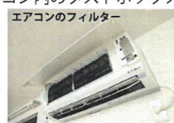
エアコンのフィルター