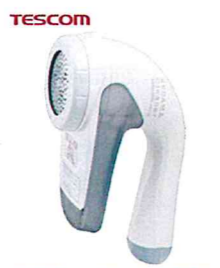
AC電源だからパワーが落ちない!

そろそろ冬物を仕舞う時期ですね。活躍した衣料ほど毛玉が出来ていませんか?そこで毛玉取り機器の登場!数ある製品の中で評価が最も高いのが、「TESCOM(テスコム)」のAC電源タイプのこちら。電池式にありがちなパワー不足もなく気持ちいいほど毛玉が取れると大人気!そこそこ音がしますが許容範囲でしょうか?超人気商品のため売り切れが頻り。amazon、楽天他や家電量販店で入手可能。 TESCOM KD778 オープン価格(3,000円前後)