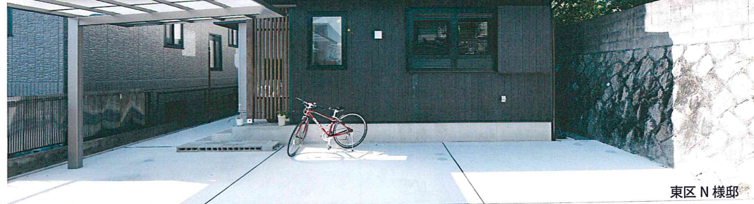
東区 N 様邸

株式会社エヌテック 〒733-0007 広島市西区大宮 2-13-7 TEL:082-509-5771 HP: http://www.ntecj.co.jp