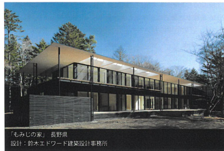
「もみじの家」長野県 設計：鈴木エドワード建築設計事務所

木造でありながら、鉄骨造や RC 造と同じ構造計算を全棟に実施。木と木の接合部には業界で初めての S ボルトを採用しています。柱・梁は集成材を、金具には独自開発による SE 金物を使用。耐力壁や床合板についても、すべて均一な品質のものを供給するなど、構造計算したとおりの材料を提供し、最大で 20 年の性能保証を行っています。また、住宅の性能を評価するために第三者瑕疵検査制度を実施して設計図面と施工現場との整合性を確認しています。こうした取り組みにより「SE 住宅性能保証」として最長 20 年の構造性能を全棟保証しています。さらに全棟「完成保証」を実施しており、万が一の事態には責任をもって工事を引き継ぎ、増加費用分を保証し、住宅の完成・引き渡しまでを確約します。「完成保証」を導入するには厳しい審査を通過する必要があるため、健全で優良な経営基盤をもった工務店しか利用できません。