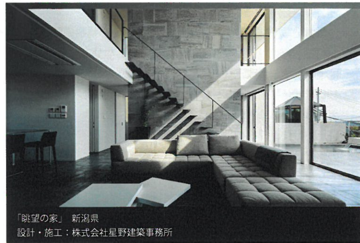
「眺望の家」新潟県 設計・施工：株式会社星野建築事務所

A. 選び抜かれた工務店だから、自由なプランとデザイン、そして安全性能を実現します