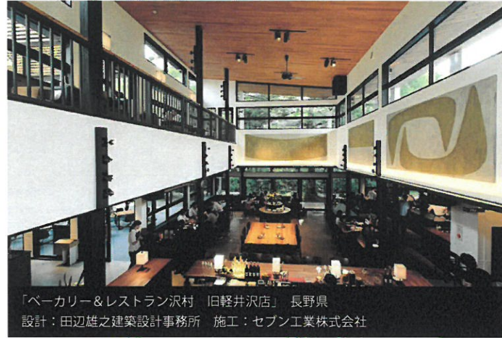
「ベーカリー&レストラン沢村 旧軽井沢店」長野県 設計：田辺雄之建築設計事務所 施工：セブン工業株式会社

木は断熱性能に優れ、人間の体に優しく、住まう人々に最良の安らぎと充足感をもたらす、はるか昔からの住宅素材です。「重量木骨の家」は木造でありながら構造的にも非常に高い耐震性能の「耐震構法 SE 構法」を採用し、これまで地震による倒壊はゼロ。そして、確かな腕をもつ選び抜かれた工務店のみがつくることを許された木造住宅です。美しさと快適さと資産価値。自由な設計と安全性能を両立する、資産としての家のあり方を考えた住宅です。そして「重量木骨の家」は全国で約 60 社の工務店しか建てられません。住まう人の思いを叶えるため、世界にひとつの木の家をつくり上げていく志。人を守り、歳月を経ても資産となる家のために、確かな構法を選び、保証やメンテナンスで長く付き合おうこと。デザイン性だけではない、住まう人を考えた家づくりができる選び抜かれた工務店だからこそ可能なのです。