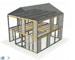
熊本地震における SE 構法の揺れを再現した動画

そして、どういう経緯で建物の倒壊に至ったのかを検証するために、3D シミュレーションソフト「wallstat (ウォールスタット)」も活用され始めました。(ぜひ「ウォールスタット」で HP 検索してみてください。検証動画もご覧いただけます。) そのソフトを使って、無被害だった熊本の SE 構法の建物を再現したシミュレーション動画 ( http://www.ncn-se.co.jp/oshirase/20161220/ ) も公開されました。熊本地震の 2 回の震度 7 の地震波に対して無事に耐える SE 構法の姿がご覧いただけます。いつか発生する巨大地震に対し、本当に安心できるお住まいを建てていただきたいと切に願います。