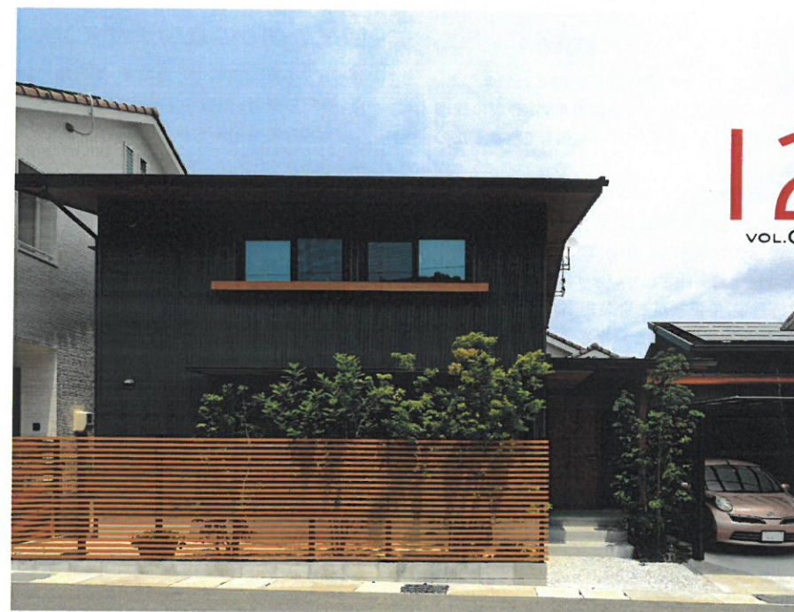
広島県安芸郡海田町W様邸