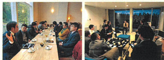
S.H.S鳥屋野店内にある「CAVE D' OCCI Toyano (カーブドッチとやの)」で意見交換