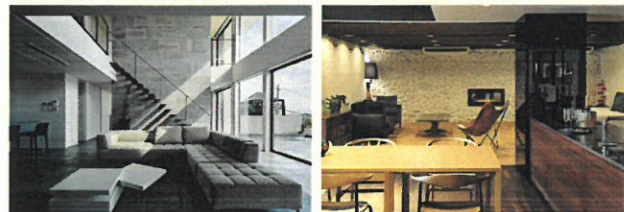
ハイクオリティビルドに認定された住宅