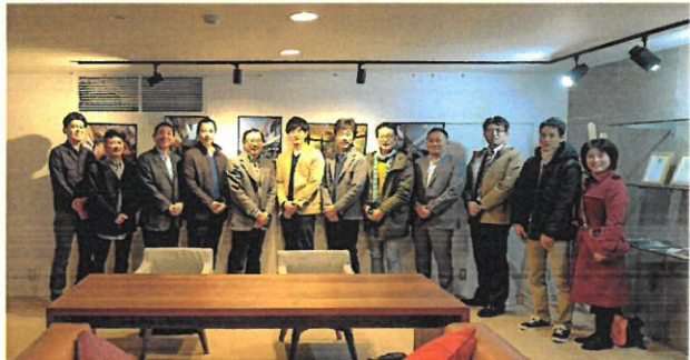
S.H.S鳥屋野店内にある星野建築事務所ショールームにて参加メンバーの記念撮影

今回の新潟出張では、最先端の住宅・店舗デザインから日本家屋の普遍的なデザインまで、たいへん刺激的な時間を過ごすことができました。これまで、パッシブデザインを始めとして、建物の温熱環境や耐震性能を重要視してきたエヌテックですが、今後のさらなるパワーアップのためデザイン力の向上も視野に入れて、皆様の家づくりのサポートを行ってまいります。良い意味で皆様の想像を裏切るようなご提案にご期待いただければと思います。