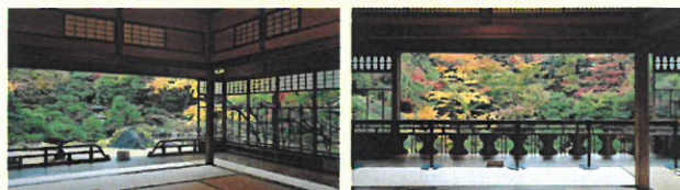
旧齋藤家別邸の1階

せっかくの新潟出張でしたので、翌日は午前中に建物見学を行いました。新潟の豪商、旧齋藤家別邸はちょうど紅葉も見頃でしたが、あいにくの雨のため庭の回遊は出来ない状態でしたが、ボランティアガイドの説明もたくさん聞け、建物内部を細部まで堪能できました。