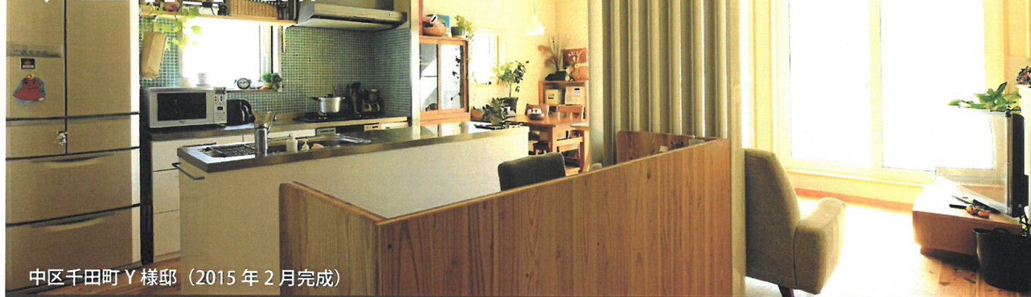
中区千田町Y様邸（2015年2月完成）

株式会社エヌテック 〒733-0007 広島市西区大宮 2-13-7 TEL:082-509-5771 HP: http://www.ntecj.co.jp