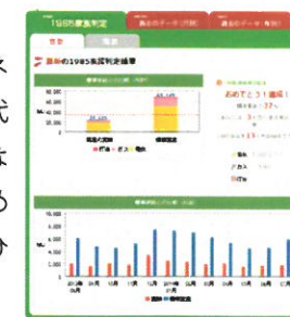
1985 アクションナビの画面

では、具体的に何から始めたらいいのでしょうか？答えは、ご自身の家庭のエネルギー消費量を知ることです。そのために便利な無料のプログラムが、「1985 アクションナビ」としてHPに紹介されています ( http://to1985.net/data/actionnavi/ )。このプログラムを利用して、ご家庭のエネルギー消費量を入力することで、同じ家族人数・同じ地域にある他の家とエネルギー消費量を比べることもできます。入力したデータは毎月蓄積されていきますので、前年と比較してどう推移しているかや、あとどれくらいで1985 アクションの目標が達成できるのかもご覧いただけます。毎月の電気やガスの使用量が書かれた紙を保管している方はぜひこのプログラムに入力してみてください。その紙はすぐに捨ててしまうという方は、今月から捨てる前に入力をしてから捨ててください。また、電力会社やガス会社に問い合わせると過去の使用量を教えていただけますので、少し面倒ですがその方法もおススメです。大切なのは、電気だと〇〇kWh、ガスだと〇〇m 3 の数字です。入力するのは金額ではありませんのでご注意ください。あなたの行動が省エネ行動のスタートとなり、子や孫の世代の地球環境まで変える大きな活動となり得ます。そして、省エネ実現のための具体的な方法を知りたい方は、ぜひエヌテックまでご相談下さい。地域アドバイザー拠点として承ります！