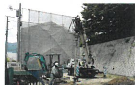
完成見学会は6月18日(日)

◀安芸高田市K様邸【SE構法】 5月末に足場を解体したK様邸。現在は内装工事を行っています。これから内部の造作工事、設備工事へと進んでいきます。K様邸は7月2日に完成見学会を開催致します。エヌテックでは第1棟目となる「パッシブ冷暖」を搭載したお住まいです。