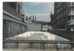
構造見学会は6月18日(日)

地盤改良工事、基礎工事を終えたU様邸は6月初旬に上棟を予定しています。また、U様邸は6月18日に構造見学会を開催致します。完成後は見えなくなってしまう大切な構造をご覧いただける貴重な見学会となっておりますので、是非お越しください。