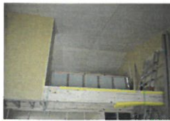
完成見学会は7月2日(日)

◀安芸高田市K様邸【SE構法】 5月末に足場を解体したK様邸。現在は内装工事を行っています。これから内部の造作工事、設備工事へと進んでいきます。K様邸は7月2日に完成見学会を開催致します。エヌテックでは第1棟目となる「パッシブ冷暖」を搭載したお住まいです。