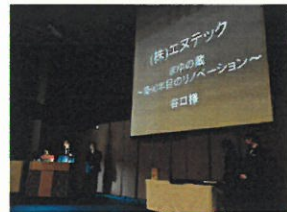
グランプリ発表の瞬間

いいか(設計や施工のレベルが高いか)、「住む人の心に光を灯せているか」、「地域に影響を与えるようなものか」という基準をお持ちでした。エヌテックのグランプリ受賞理由としては、全体的にバランスが良く、レベルが高いという点を評価していただきました。グランプリ受賞の副賞として、2017年11月発売予定の全国紙「BEST Reform」にて、まゆの蔵が表紙を飾り、紙面では4ページの特集で紹介されます!