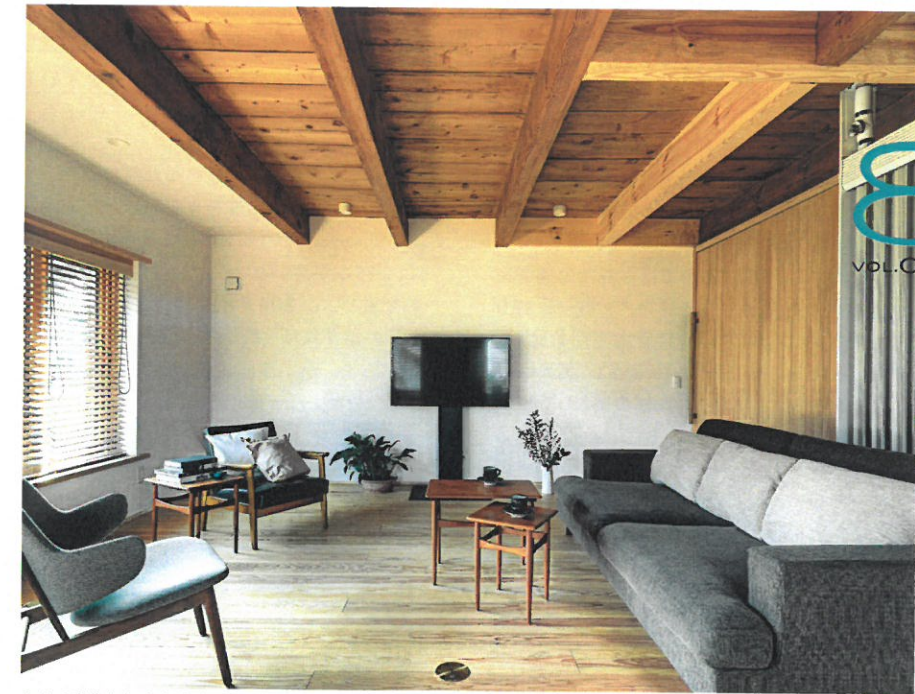
まゆの蔵[広島市安佐南区] 全国リフォームアイデアコンテストでグランプリ受賞!