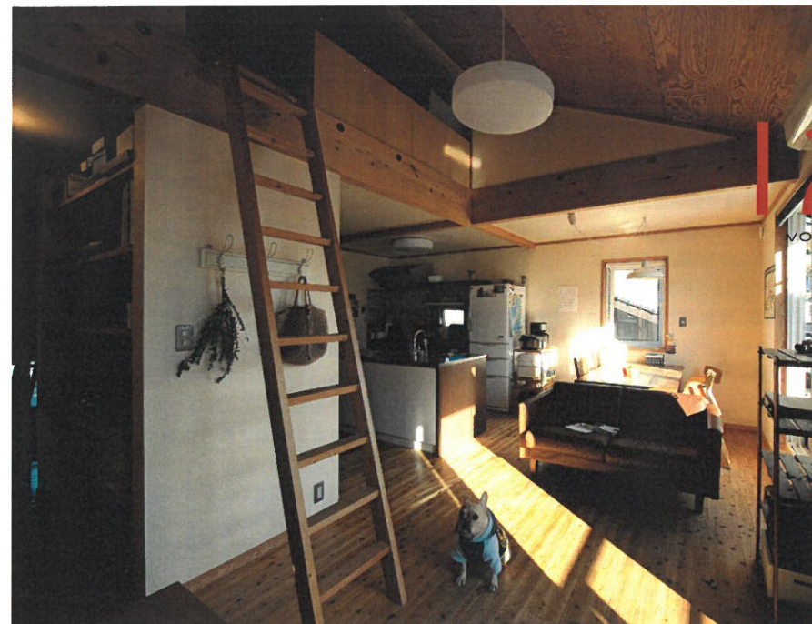
広島市安佐南区M様邸