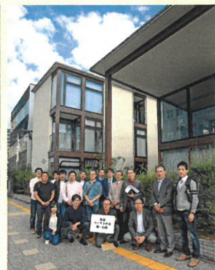
本社前で記念撮影