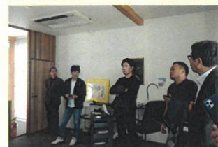
つくり手の会員に説明する高倉副社長（写真中央）

当日は13時に大分駅に集合し、徒歩3分で着く本社の視察や打合せ室で会社紹介をしていただき、その後は建設中のモデルハウスの視察を行いました。