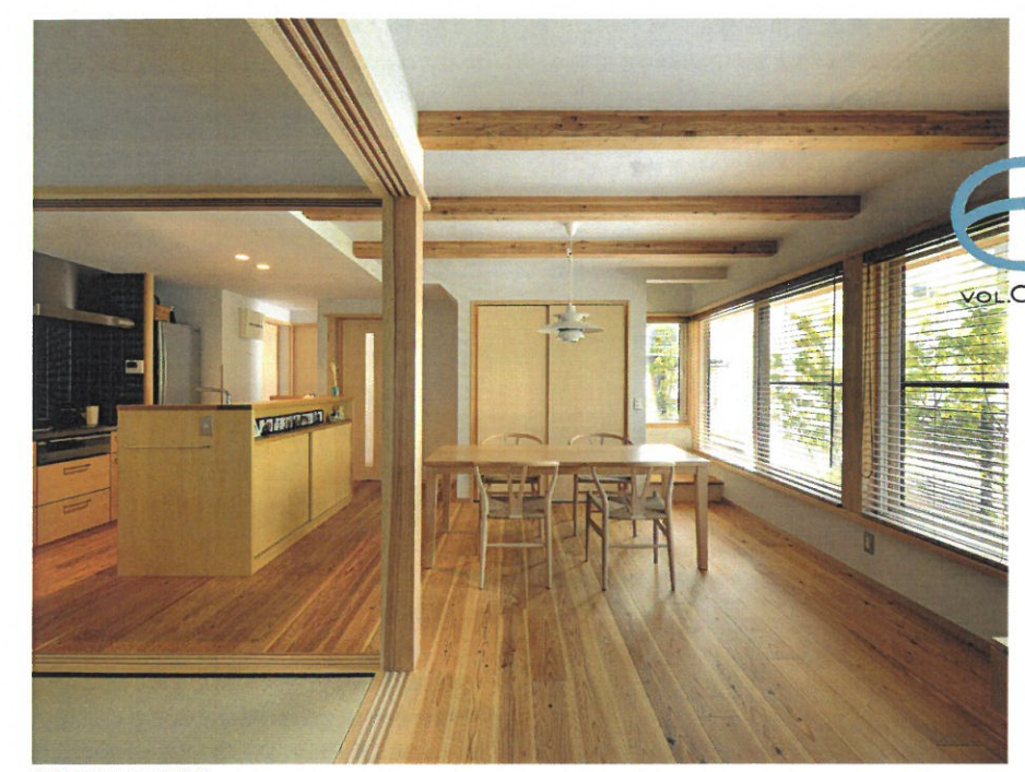
安芸郡海田町W様邸