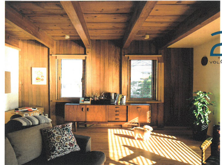
広島市安佐南区 まゆの蔵