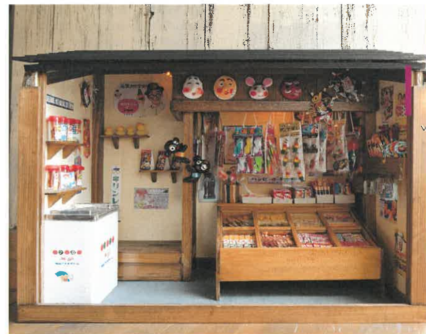
キンカンの工作室 ミニチュア作品