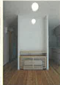
TVボードの下にエアコンを配置。床下から暖めます