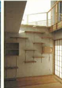
キャットステップを使って吹抜を猫が動き回ります