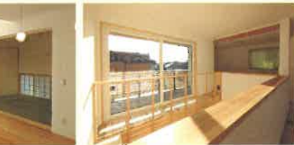
キャットウォークの隣の部屋にも猫が行けるよう建具に小さな四角い穴が!