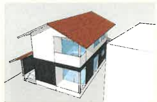
建て替え案。隣が空き地なので冬の日射が室内まで深く届きます