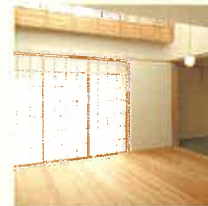
リビングと玄関をつなぐ6畳の和室。収納もたっぷり確保