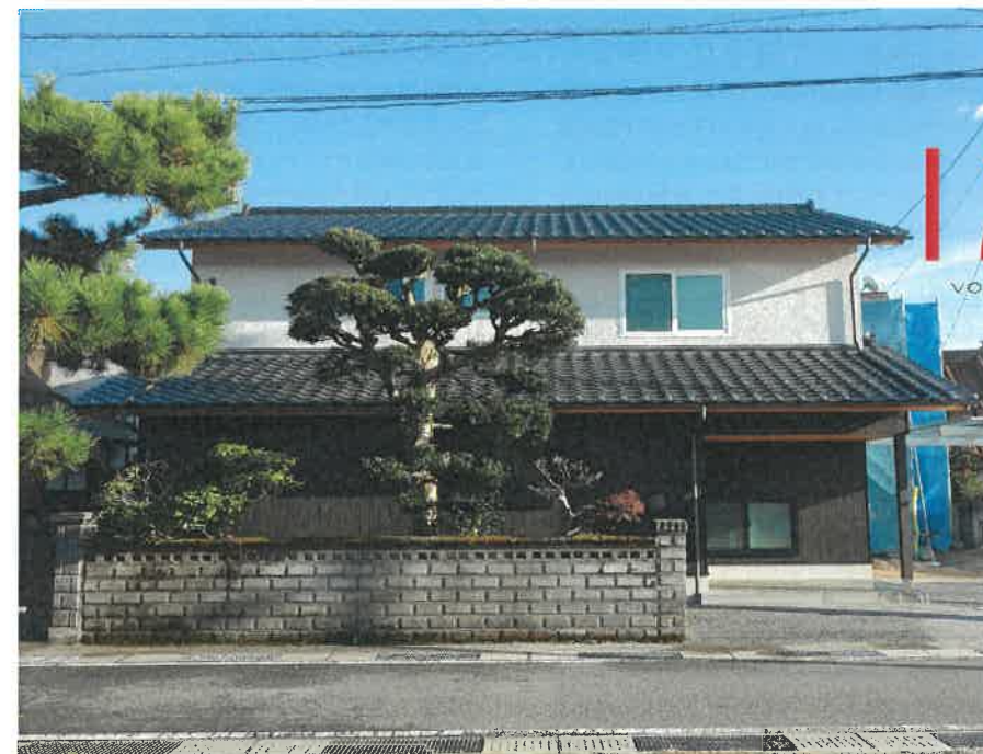
東広島市黒瀬町乃美尾T様邸 2020年11月完成