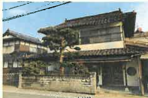
解体前のお住まい。地域性を考慮して、新築を計画する際の参考にしました