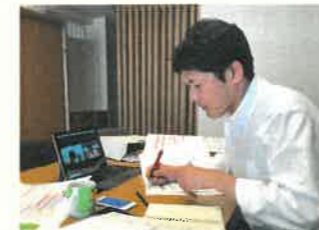
オンラインでの打合せ風景

これまでホームページには月1回開催のペースで、ハツイエセミナーやパッシブデザインセミナーをご案内してきました。また、お客様それぞれの状況に応じて、各種セミナーの個別開催も実施してきました。実際にお会いしながら弊社の思いを伝えさせていただくこのペースは変えずに、今後はオンラインでのセミナー開催も増やしていこうと現在準備中です。ホームページのイベント案内から、オンラインかご来場かご希望を選択できるようにしたり、カレンダー形式でセミナー開催可能日時を表示したりする予定です。これまで以上に、お気軽に弊社までお問い合わせをいただけるきっかけとなりましたら幸いです。皆様からのご要望もぜひお聞かせください。