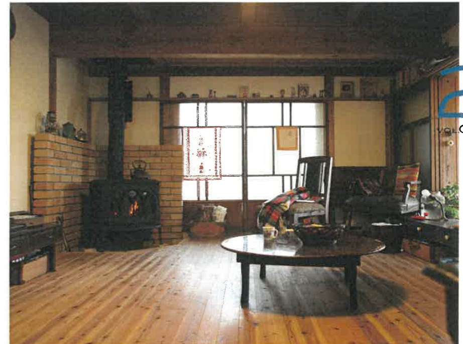
東広島市西条町T様邸 古民家再生