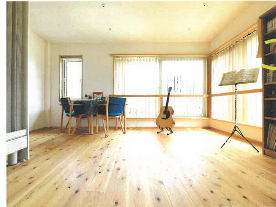
広島市東区 W 様邸