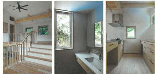
スキップフロア上階の階段はベンチのような設え

二世帯住宅のスタイルとしては、玄関のみ共通でそれぞれの世帯にキッチン・洗面・トイレ・ユニットバスが備えられた構成です。床材は1階にヒノキを採用し、蜜蝋ワックスが塗られた上品な肌触りが特徴です。スキップフロアは下階がワークスペースで上階を家族の図書スペースとして計画。立体的なつながりがきつと毎日を楽しみさせることでしょう。200㎡を超える二世帯住宅ということもあり、工事期間も通常よりも長くかかってしまいましたが、お客様からは「現場が綺麗」「職人さんの仕事熱心で丁寧」など、たくさんのお声かけをいただきました。もうすぐ新しいご家族も増えるとのことですので、このお住まいをご家族皆様のカラーに染め上げていただきたいと思います。家にはいる時が一番豊かな時間となるよう願っております。