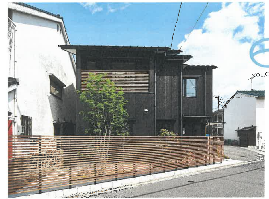
広島市東区戸坂 1様邸 大規模改修工事