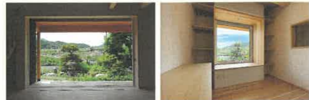
底とつながる二間幅の大開口引き込みサッシ。樹脂窓なので断熱性能も高い