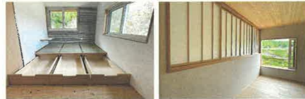
小上がり量のある洋室。引き出し収納で空間を有効活用