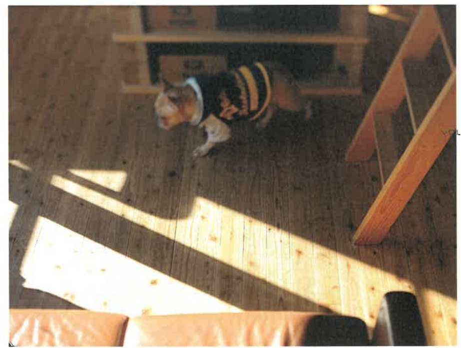
広島市安佐南区 M様邸