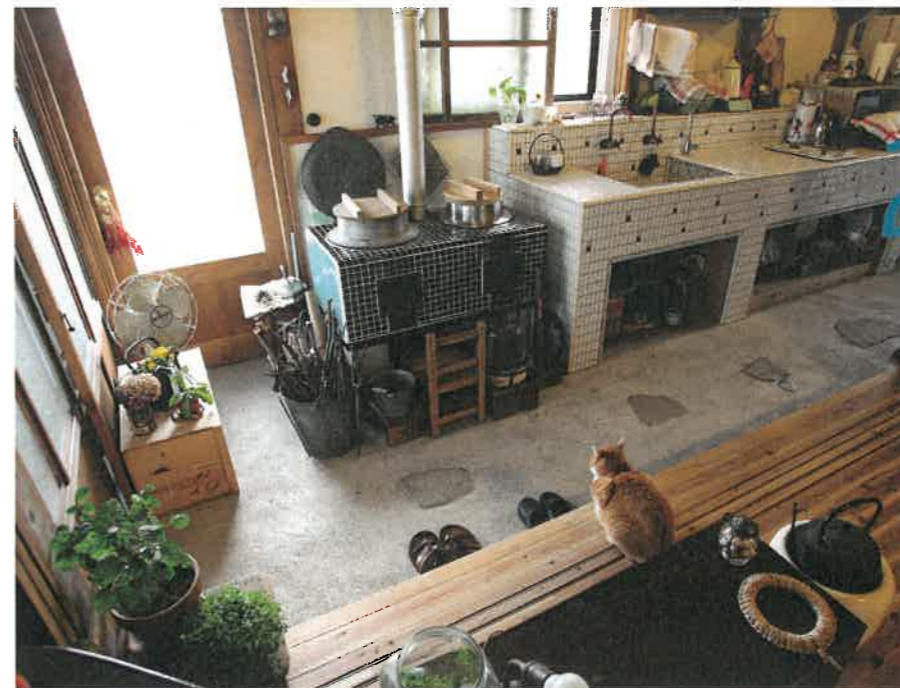
東広島市 民家再生 T様邸