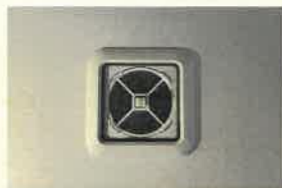
↑外の光が見えにくい状態 ↓つまみを持ってフィルターを取り外します