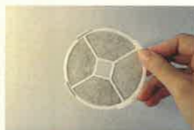
↑掃除後のフィルター ↓外の光がフィルター越しに見えるようになりました