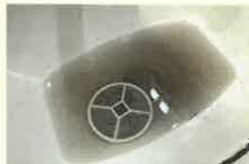
↑ぬるま湯につけるだけでも汚れが浮いてきます

フィルターをぬるま湯につけて汚れを取り除きます。取れにくい場合は歯ブラシなどでやさしく擦り洗いをするとスッキリ綺麗になります。洗った後は、雑巾で挟んで水分を吸い取り、さらに陰干しで完全に乾かします。フィルターを外したら給気口本体についている汚れも一緒に拭き取ってしまいましょう!硬く絞った雑巾やキッチンペーパーで汚れを拭き取ります。手が届きにくい所は割り箸に古い布やキッチンペーパーを巻きつけた棒を使うと簡単に奥まで掃除できます。本体もフィルターも綺麗になったら、取り外しと逆の手順で取り付けを行います。掃除前と後の写真を見比べると一目瞭然ですね!これから花粉の季節もやってきますので、結露対策、花粉対策におすすめです。フィルターが痛んでいる場合は買い替えて交換することもできます。気になる方はお気軽にお問い合わせください。