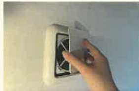
↑フタを上からスライドすると外すことができます

給気口のフタを上からスライドして外します。フィルターが黒くなっている、外の光が見えにくくなっている場合は汚れが詰まっているので、フィルターを取り外します。フィルターの目詰まりをチェックするもう1つの方法は、給気口を開けた時に空気が入ってきているかを確認する方法があります。給気口を開けた状態で手をかざし、空気をしっかりと感じる事ができれば給気が出来ている証拠です。給気口を開けているのに空気をあまり感じない場合は、フタを外してフィルターをチェックしてみてください。下の写真のように汚れていると目詰まりが原因で換気が十分に行われていないかもしれません。