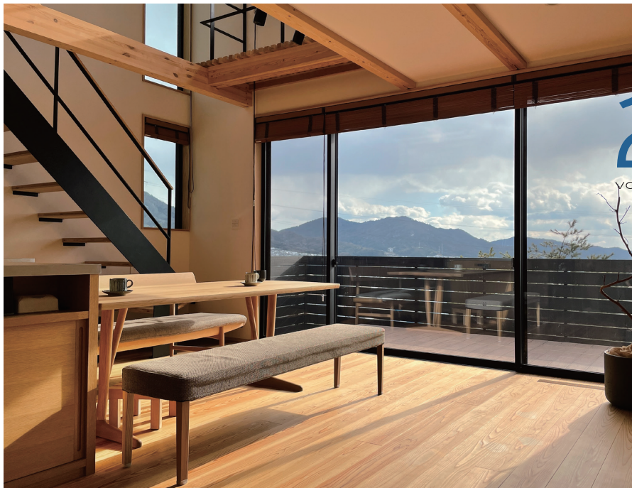
広島市安佐北区 N様邸