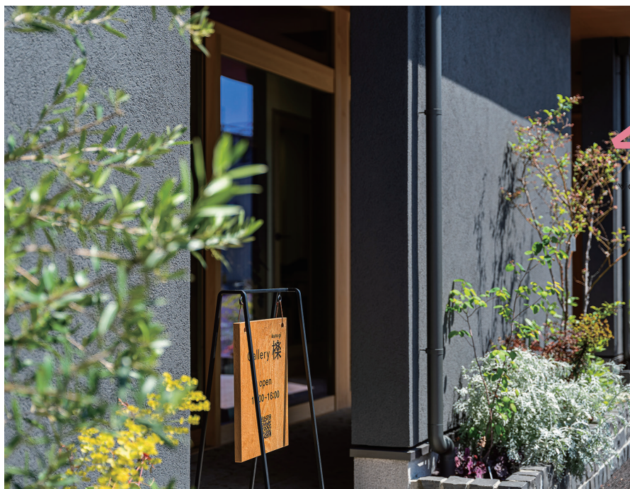
広島市安佐南区西原 Gallery棟